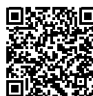
Herstellerdatenblatt Art. Nr. 3000213

For connecting the power supply, please refer to the relevant documentation from the power supply manufacturer. The power supplies included in the set are adjustable. The correct current setting is already set upon delivery and must NOT be changed!